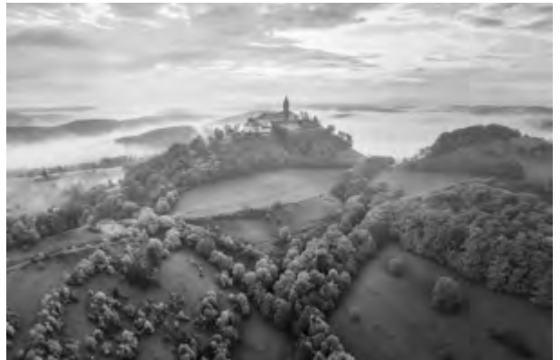
Die Leuchtenburg im Jahr 2023. Heute wird die Burganlage touristisch genutzt, jährlich besuchen knapp 90.000 Gäste die Ausstellungen.