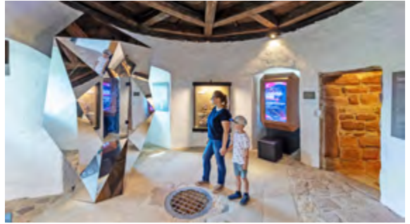
Blick in den Ausstellungsteil zur Zuchthauszeit im Wehrturm der Leuchtenburg mit digitalem Spiegel und Recherchedatenbank.

Der digitale Spiegel wurde dafür in eine raumhohe polygonale Skulptur gefasst, die allein bereits Aufmerksamkeit erzeugt und in unterschiedlichen Ansichten und Brechungen sein Gegenüber reflektiert.