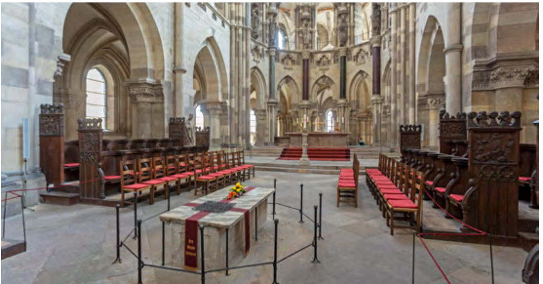
Das Grab Ottos des Großen, Magdeburger Dom

Begonnen hatte sie in Italien, wo Otto sich bereits sechs lange Jahre aufhielt. Er hatte hier zuvor den Markgrafen von Ivrea Berengar II. in die Schranken gewiesen und damit einen wichtigen Konkurrenten um die Krone Italiens besiegt. Damit gelang Otto zugleich eine Sicherung des Papsttums, das durch Machtkämpfe und moralischen Verfall in eine Krise gegliitten war. Auf einer Kirchenversammlung in Ravenna 967 setzte Otto die Gründung des Erzbistums Magdeburg durch, die im Jahr darauf auch Papst Johannes XIII. bestätigte. Otto konzentrierte sich daraufhin auf eine Annäherung an Byzanz und strebte eine Ehe seines gleichnamigen Sohnes mit einer aus diesem Reich stammenden Prinzessin an. Nicht weniger als acht Gesandtschaften schickte er an den Hof nach Konstantinopel. Nachdem sich Johannes Tzimiskes des byzantinischen Throns 969 bemächtigt hatte, gingen Ottos Pläne schließlich auf. Der neue Kaiser von Byzanz übergab der ottonischen Familie seine Nichte Theophanu als Braut für Otto II. Mit einem pompösen Fest wurde die Ehe zwischen beiden am 14. April 972 in Rom vom Papst geschlossen. Otto II. und Theophanu wurden zugleich zu Mitkaiser und Mitkaiserin gekrönt. Nach diesen, für das Erbe seiner Herrschaft wichtigen Errungenschaften trat der Kaiser samt seiner Familie im Jahr 972 von Rom über Ravenna, Pavia, Konstanz, Ingelheim, Tribur, Nierstein, Frankfurt am Main und Tiel den Rückweg in die heutige Region Sachsen-Anhalt an.