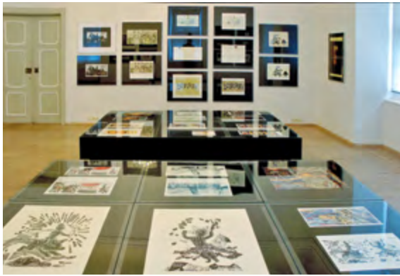
Der erste Raum der Palmbaum-Ausstellung auf Schloss Burgk, Foto: Jens-F. Dwars (Jena).