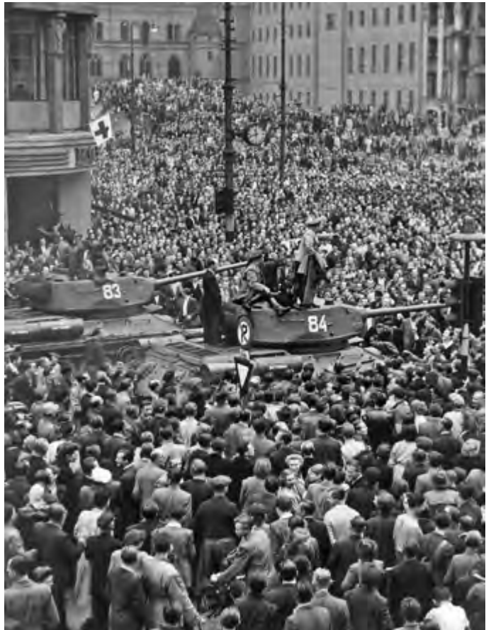
Sowjetische Panzer rücken gegen die Aufständischen vor, © Foto: 70 Jahre DDR-Volksaufstand/AdsD/FES; 6/FOTB003466, Quelle: Bundesstiftung Aufarbeitung.

Am siebzehnten Juni zu Arbeitsbeginn versammelten sich die meisten Arbeiterinnen und Arbeiter der Baustelle in der Hauptstraße vor dem kleinen Gebäude mit dem ehemaligen Ladengeschäft, in dem jetzt die Bauleitung untergebracht war. Einige Kollegen hatten ein Transparent vom Maifeiertag übermalt und unsere Forderungen nach Rücknahme der Regierungsbeschlüsse draufgeschrieben. Als sich unser Demonstrationzug in Bewegung setzte, gingen die Mitglieder der Bauleitung, die Frauen und Männer aus dem Baubüro und der BGL-Vorsitzende voraus. Der Parteisekretär war nicht erschienen. Der lange Marsch ins Zentrum durch Niederschönhausen und Pankow und ab U-Bahnhof Vinetastraße die ganze Schönhauser-Allee entlang begann. Auch an diesem Tag schien die Sonne. Es war warm und alle befanden sich in einer Art Festtagsstimmung. Vermutlich ging es den anderen ähnlich wie mir: In mir war eine erwartungsvolle Erregung, wie ich sie als Kind verspürte, wenn die Eltern mit uns in den Zirkus oder auf den Jahrmarkt gingen. Je näher wir dem Ereignis kamen, umso deutlicher waren Musik und Lärm zu hören, umso größer wurde unsere Spannung. Versetze ich mich in die Vormittagsstunden des siebzehnten