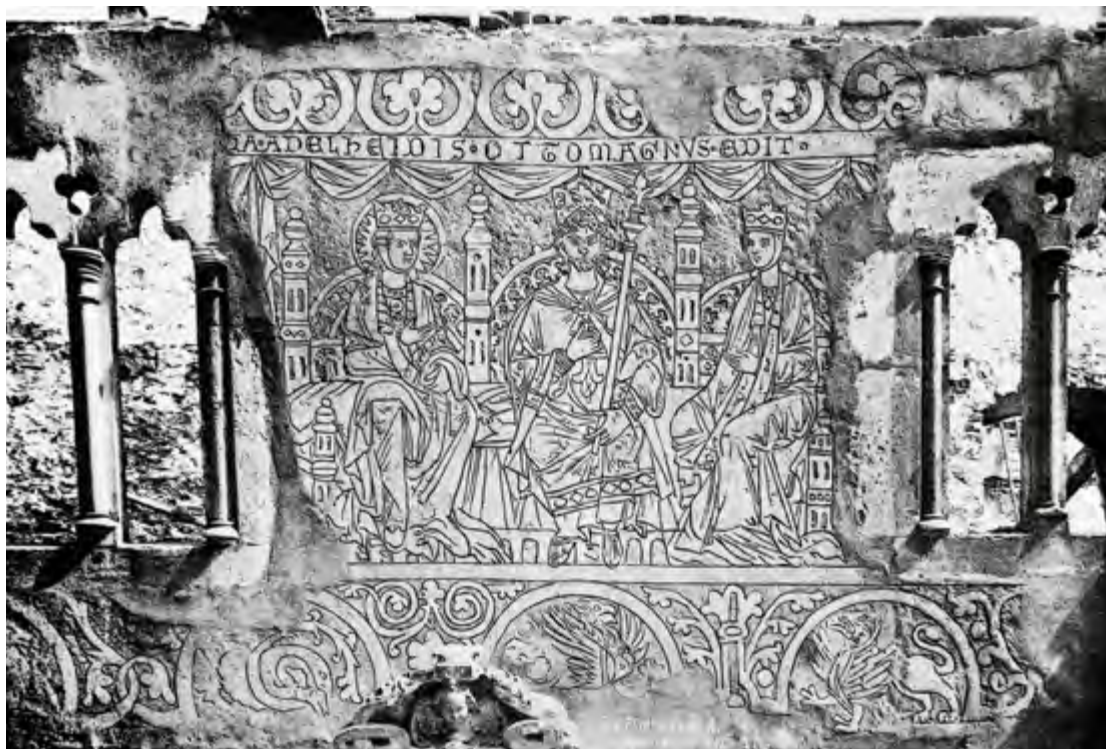
Putzritzzeichnung mit Otto dem Großen und seinen beiden Ehefrauen Editha und Adelheid. Magdeburg, Dom St. Mauritius und St. Katharina, östlicher Kreuzgangflügel, Foto: E. v. Flottwell 1891.

In Quedlinburg sind es wiederum drei authentische Orte, an denen ottonische Geschichte anschaulich wird: das Schloss auf dem Stiftsberg, die Stiftskirche St. Servatii und die südwestlich im Tal gelegene Kirche St. Wiperti. Der Stiftsberg überragt die Stadt und ist zugleich der Kern des UNESCO-Weltkulturerbes Quedlinburg. Derzeit laufen hier umfangreiche Sanierungs- und Baumaßnahmen an den Gebäuden des einstigen Damenstifts. Voraussichtlich gegen Ende 2024 erwartet Besucherinnen und Besucher dann ein gänzlich neugestalteter musealer Rundgang durch das beeindruckende Ensemble aus Stiftskirche, Stiftsgebäuden, Schloss und Gärten. Bis dahin lohnt dennoch der Aufstieg auf den Schlossberg. Die Stiftskirche St. Servatii, mit ihrem bedeutenden Domschatz und der Grablege König Heinrichs I. in der romanischen Krypta, kann nämlich besichtigt werden. Ein Spaziergang durch die Stiftsgärten auf dem Bergplateau bietet einen bezaubernden Blick über die historische Fachwerkstadt Quedlinburg. Zudem empfiehlt sich ein Besuch der romanischen St. Wipertikirche, die auf dem Gebiet der ehemaligen Kaiserpfalz liegt und baulich bis in die Zeit um 1000 verweist. Zu den Höhepunkten zählt hier eine nachträglich in die Kirche eingebaute Krypta, in der die Ottonenzeit ganz nahe scheint.