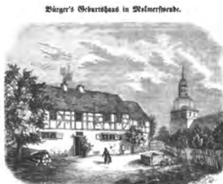
Pfarrhaus und nördlicher Anbau von Südosten, 1848