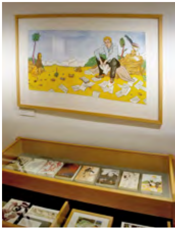
Palmbaum-Bild von Moritz Götze und Vitrine im Jenaer Romantikerhaus.

Die bislang 35 illustrierten Hefte, die Andrucke ihrer Einbände und deren originalgrafischen Vorlagen ergeben in ihrer Vielfalt eine ebenso hochkarätige wie abwechslungsreiche Ausstellung, die zum dreißigjährigen Bestehen der Zeitschrift an drei Orten zu sehen war: Im Januar und Februar gastierte sie im Foyer des Literaturhauses Leipzig. Der begrenzte Raum nötigte zur Konzentration auf ein Dutzend Bildbeispiele, während die Hefte und kleinere Grafiken in acht Vitrinen auslagen.