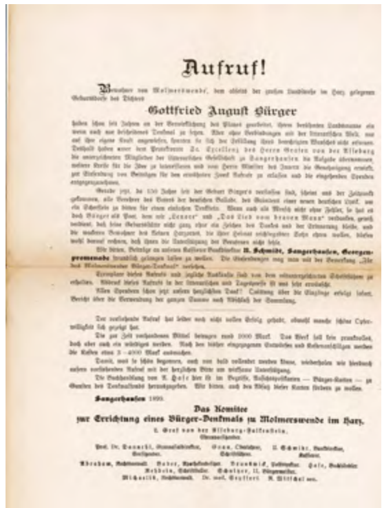
Spendenaufwurf der Literarischen Gesellschaft Sangerhausen