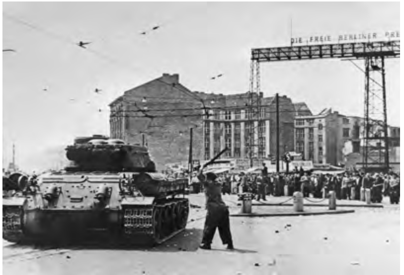
Ein Mann schlägt mit einer Stange auf einen sowjetischen Panzer, Nähe Potsdamer Platz, Bild Nr. 203037, Quelle: Bundesstiftung Aufarbeitung.

ling. Die Bevölkerung musste verzweifelt zur Kenntnis nehmen, dass sie gegen diese Macht nichts ausrichten konnte. Die Streiks in den Betrieben hielten noch länger an, wenn sie nach dem 20. Juni auch nur noch den Charakter von Warnstreiks hatten. Zahlreiche Betriebe wurden von sowjetischen Truppen oder der Kasernierten Volkspolizei besetzt, so dass weitere Streiks nicht mehr möglich waren. Manchmal handelten die Belegschaften als Gegenleistung für die Arbeitsaufnahme den Abzug der Soldaten aus dem Betrieb aus. So zogen die sowjetischen Panzer vor dem Zeiss-Werk in Jena am 21. Juni ab, als die Belegschaft die Beendigung des Sitzstreiks unter dieser Bedingung zugesagt hatte.