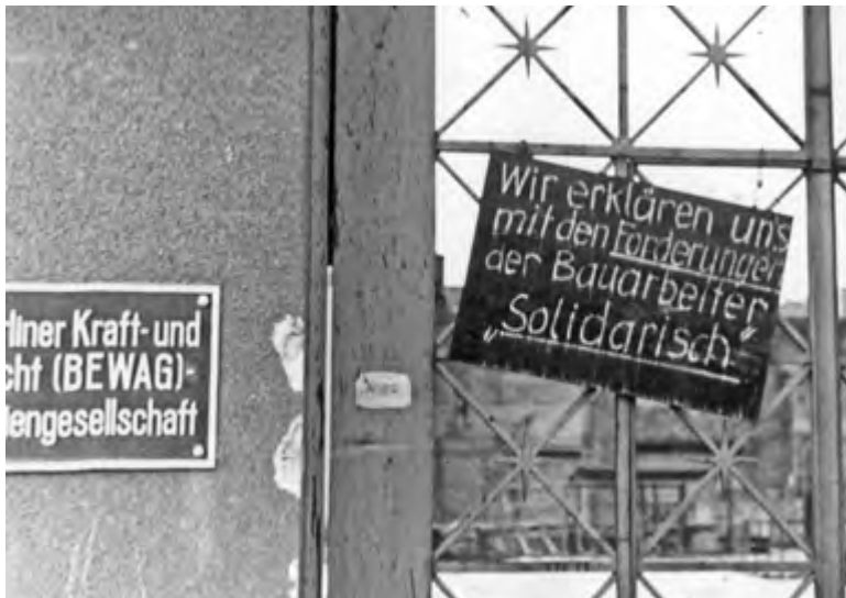
Schild am Eingang des Ost-Berliner Bewag-Hauptgebäudes, © Foto: 70 Jahre DDR-Volksaufstand/AdsD/FES; 6/FOTB002891, Quelle: Bundesstiftung Aufarbeitung.