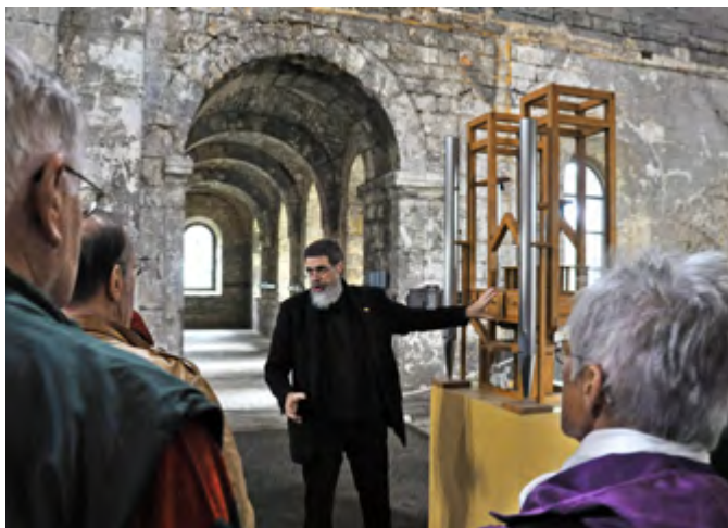
Besucher der Burchardi-Kirche fragen nach den Geheimnissen der Cage-Orgel