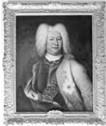
Herzog Friedrich II. von Sachsen-Gotha-Altenburg. Er ordnete im Jahr 1720 an, die Leuchtenburg fortan als Zucht- und Besserungsanstalt zu nutzen und dafür großflächig umzubauen.

Herrschaftsbereich waren immens. Im Februar schreibt der Herzog an seine Räte: „Nachdem aber die entworfenen Gebäude dergestalt weitläufig und kostbar, daß nach denen darzu deputirten wenigen Mitteln solche dergestalt zu errichten fast schwer anscheinen will, gleichwohl aber die Noth im Lande wegen des losen Gesindels dergestalt zunimmt, daß fast Niemand mehr, auch in wohlverwahrten Häußern, vor deßen Gewaltthätigkeit und Einbruch gesichert [...]“ Bereits 1722 sollte der Anstaltsbetrieb aufgenommen werden, als Seelsorger und Geistlicher war Johann Gottlieb Bergmann designiert, denn „[...] sind der Christ. Fürstl. Gemüther auch dahin besorgt gewesen, daß nebst der leibl. Versorgung derer auff gedachtes Hauß gebrachten Personen, auch die Seelsorge möchte beobachtet werden.“, schreibt Bergmann selbst in der Vorrede seines Kirchenbuches. „Weil es sich aber mit dem Bau biß in das 1724te Jahr verzogen [...]“, kamen die ersten Häftlinge erst am 14.9.1724 auf die Burg.