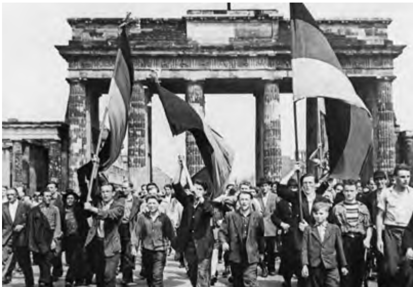
Demonstranten mit Fahnen gehen durch das Brandenburger Tor, Bild Nr. 203056, Quelle: Bundesstiftung Aufarbeitung.

In etwa 600 Betrieben kam es zu Arbeitsniederlegungen, an denen etwa eine halbe Million Beschäftigte beteiligt waren, und in zirka 400 Städten und Ortschaften wurde demonstriert oder brachen Unruhen aus. Vor allem in den Städten der industriellen Ballungsräume entfaltete der Aufstand eine größere Kraft. In den traditionellen Industriegebieten um Halle, Leipzig und Gera hatten die Streikbewegung und der Aufstand eine größere Intensität als in Berlin, ebenso in Cottbus, Magdeburg, dem Industriegürtel im Harzvorland und in Potsdam. In Dresden streikten fast genauso viele Arbeiter wie in Berlin. In diesen Ballungsräumen wurde auch ein deutlich höherer Organisationsgrad erreicht als in Berlin. Streikleitungen – vereinzelt auch überregionale – wurden gewählt, und häufig wurden die Gewerkschaftsfunktionäre gezwungen, Resolutionen oder Erklärungen der Belegschaften zu unterschreiben. Diese Gebiete waren vor 1933 Zentren der kämpferischen deutschen Arbeiterbewegung gewesen, und an diese Tradition wurde nach 20 Jahren nun wieder angeknüpft. Diesmal aber wollten die Arbeiter nichts mehr von den kommunistischen Kadern wissen. Wenn dies noch möglich war, wurden ältere Sozialdemokraten in die Komitees oder zu deren Vorsitzenden gewählt, wie in Dresden, wo der Alt-Sozialdemokrat Wilhelm Grothaus als Sprecher hervortrat.