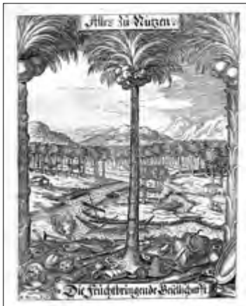
Kupferstich der „Fruchtbringenden Gesellschaft“ aus dem Jahr 1646, des Vorbilds der Zeitschrift.

Die Thüringer Literaturzeitschrift heißt nicht „Tannenbaum“, weil sie nicht (nur) Wiesen und Wälder besingt. Ihr Name ist „Palmbaum“ nach dem Vorbild des Palmenordens. Am 24. August 1617 kamen Vertreter der protestantischen Höfe Mitteldeutschlands in Weimar zusammen, um der Herzogin Dorothea Maria von Anhalt (1574–1617) zu gedenken, der Mutter des Herzogs Johann Ernst von Sachsen-Weimar (1594–1626) und Schwester des Fürsten Ludwig I. von Anhalt-Köthen (1579–1650). Das Treffen wäre längst vergessen, hätten die Hochadligen am Rande der Begräbnisfeier nicht etwas ganz und gar Ungewöhnliches beschlossen: Kein Wirtschafts- oder Aufrüstungsprogramm, wie man es von den heute Herrschenden erwarten würde – am Vorabend des furchtbarsten aller Kriege, der 30 Jahre lang tobten und Deutschland verheeren wird, gründeten die Fürsten die „Fruchtbringende Gesellschaft“, den ersten Verein zur Förderung der deutschen Sprache und Literatur.