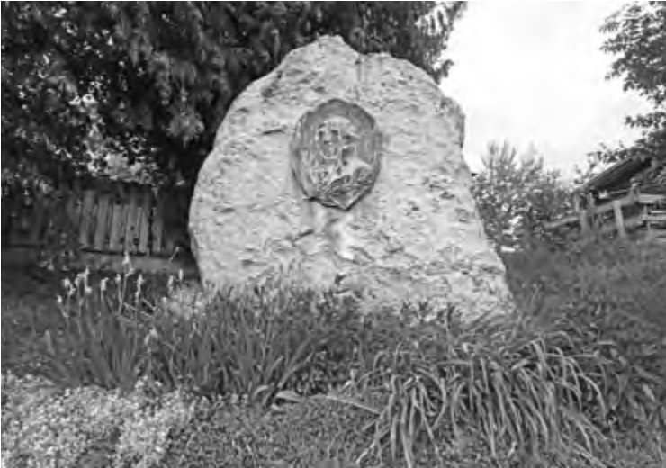
Findling mit dem Relief von Arnold Künne, Denkmal für Gottfried August Bürger in Molmerswende.

die Aufzählung der Bemühungen von 1948 bis zum September 2023 um die Errichtung eines Museums im Geburtshaus für Gottfried August Bürger füllen. Einige Beispiele seien genannt: 1948 fand in Molmerswende eine „Bürger-Feier“ statt. Die Landesregierung spendete dafür 3000 Mark, ein kleiner musealer Raum entstand im Geburtshaus. Ab 1969 wurde eine Vereinbarung zwischen der Kirchengemeinde und der Gemeinde Molmerswende geschlossen über die Umnutzung des ehemaligen Pfarrhauses zum Gottfried-August-Bürger-Museum. 1983 verließen die letzten Bewohner das Haus, und es konnte nun insgesamt