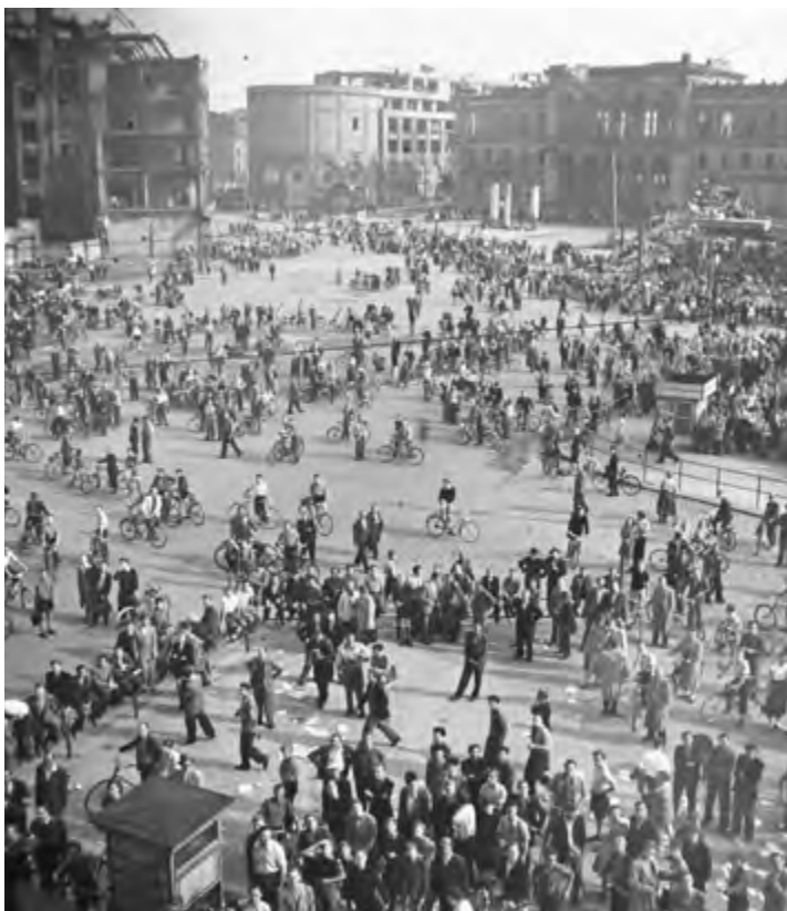
Menschenansammlung auf dem Potsdamer Platz, Bild Nr. 12079, Quelle: Bundesstiftung Aufarbeitung.

Die Stunden des sechzehnten und siebzehnten Juni 1953 erlebte ich mit unterschiedlicher Stimmungsqualität: Der Vorabend war bestimmt von Ärger, Zorn und Entschlossenheit. Hoffnung, Spannung und Euphorie trugen mich in den ersten Stunden des siebzehnten Juni. Mittags überwogen Erstaunen, Angst und Erschrecken, am späten Nachmittag vergebliches Warten auf Zeichen oder Wunder, und am Abend begann die Sorge um die eigene Zukunft und das Schicksal all derer, die sich „zu weit aus dem Fenster gelehnt“ hatten. Das Gefühl des Triumphs konnte sich nicht einstellen, da die Teilnahme an Streik und Demonstration in der DDR keineswegs als Heldentat galt. Im Gegenteil: Noch Jahre später entschied die Prüfung der Frage „Wo waren Sie am siebzehnten Juni?“ über Aufstieg und Fall in beruflichen Karrieren.