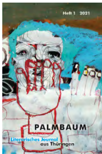
Heft 1/2021 mit einer Zeichnung von Rüdiger Giebler zum Thema „Zensur“.

Aufständische Arbeiten reißen an der Grenze zum amerikanischen Sektor das Sektorenschild des „demokratischen“ (sowjetischen) Sektors nieder, © Foto: 70 Jahre DDR-Volksaufstand/AdsD/FES; 6/FOTB002901.