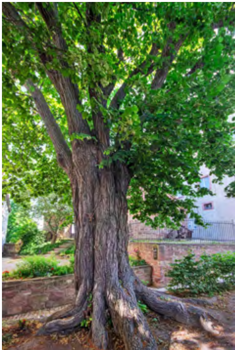
300-jähriger Lindenbaum im Burghof, Foto: Günther Kühnel, Unifok Jena e.V.

In einer weiteren Raumnische steht ein sich dem Spiegel unterordnender mannshoher Monitor, eingefasst in eine rostige Stahloptik. Über ein Touchdisplay ermöglicht dieser nun eine umfassende Einsicht in die Datenbank aller Häftlinge, wahlweise mit zusätzlichen Dokumenten, für all diejenigen, die aufgrund der emotionalen Ansprache sich auf eine tiefere Vermittlung einlassen wollen. Die Aktenlage zur Straf- und Besserungsanstalt könnte kaum besser sein. Von Personal- und Kriminalakten, von herzoglichen Kanzleiakten bis zu kirchlichen Chroniken ist eine derart große Zahl an originalen Zeugnissen erhalten, dass mit der aktuell zugänglichen Ausstellung lediglich eine erste Basisarbeit geleistet wurde, die noch viele Jahre fortzuführen sein wird.