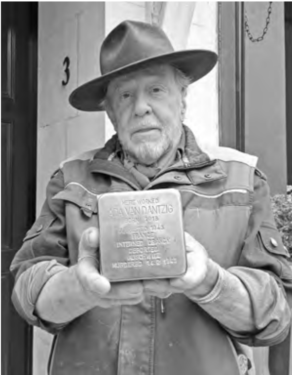
Sofern der letzte Wohnort eines Menschen nicht mehr bekannt ist, wird mitunter der Arbeitsplatz auf dem Stolperstein angegeben

Auch mit seinem bekanntesten Projekt, den Stolpersteinen, macht der Künstler bis heute nichts anderes: Er zeigt Flagge. Wie er auf den Namen „Stolperstein“ kam, der inzwischen europaweit ein Begriff ist, kann Demnig nicht mehr rekonstruieren. Nach seinen Kunststudien in Berlin und Kassel arbeitete er zunächst in den Bereichen Denkmalsanierung und Bauleitung. Über das Organisieren von Installationen und Performances kam er in den 1980er Jahren zurück zur Kunst. Anlass für die erste Steinverlegung war eine als einmaliges Ereignis geplante Kunstaktion, die an die Deportation von Sinti und Roma aus Köln erinnern sollte: Am 16. Dezember 1992 wurde ein Stein mit einer Messingplatte vor dem historischen Kölner Rathaus in den Boden eingelassen. Anders als bei den bekannten Nachfolgern, wurde in diesen Teststein kein Name einer Person eingraviert, sondern in einem 15-zeiligen Text der Deportationsbefehl Heinrich Himmlers zitiert, beginnend mit „Auf Befehl des Reichsführers-SS vom 16.12.1942 ...“ – womit der Bezug zum Datum des Verlegens hergestellt ist, sodass der Rest des Nazi-Textes entbehrlich wird. Aus heutiger Sicht ist es eine sehr gute Entscheidung gewesen, auf folgenden Gedenksteinen nicht den Tätern, sondern den Opfern eine metallene Plattform zu geben.