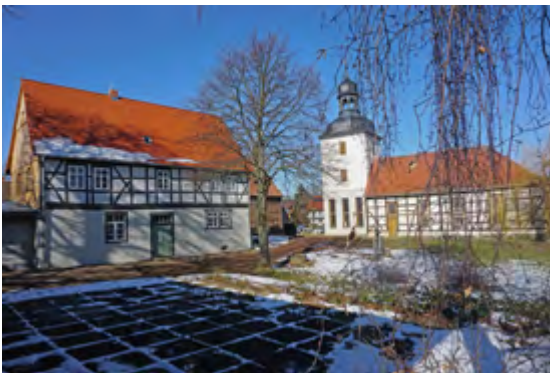
Kirche St. Stephani und ehemaliges Pfarrhaus in Molmerswende (Bürgerhaus) 2023