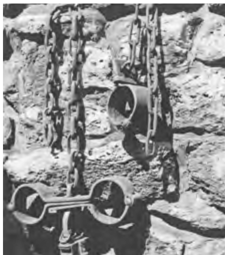
Originale Zuchthausketten, Foto: Guntard Linde, Archiv Museum Leuchtenburg.

Die Einzige, die tatsächlich ein Jubiläum hat, ist die alte Burglinde. Sie wurde mutmaßlich zur Errichtung des Zuchthauses um 1724 gepflanzt und begrüßt als Grande Dame jeden Gast am Torhaus persönlich. Dazu ist bereits ihre Wurzel als grüßendes Zeichen aus der Mauer heraus gewachsen und für ihre weitere Entwicklung wurde extra Platz zwischen den Sandsteinen gelassen. Die majestätische Sommerlinde hat aktuell einen Stammumfang von 3,99 m, einen Durchmesser von 1,27 m und eine den gesamten vorderen Burghof überragende Krone. Im Jahr 2024 soll unter ihr gern wieder getanzt und gesungen werden, im Kontrast zum Redeverbot, was damals im Zuchthaus herrschte. Anlässlich des 300. Gedächtnisjahres der Leuchtenburg als Zucht-, Armen- und Irrenhaus soll auch mit einem Kunst- und Musikfestival sowie spezieller Erlebnispädagogik in das Burgleben von vor 300 Jahren eingetaucht werden. Die Stiftung Leuchtenburg lädt als Burgeigentümerin an 365 Tagen ein, die verschiedenen Facetten dieser Zeit kennen zu lernen.