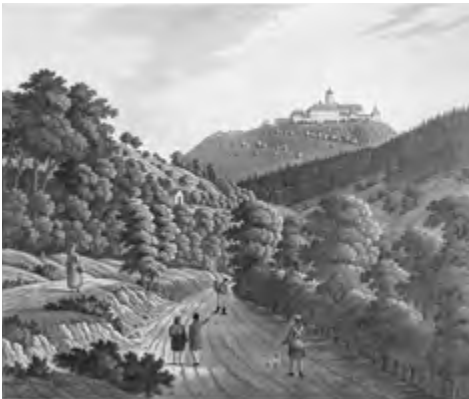
Die Leuchtenburg, Lithografie von Christian Carl Ludwig Hess, um 1850, Quelle: Archiv Museum Leuchtenburg.

Erst seit 150 Jahren ist die Thüringer Höhenfestung Leuchtenburg ein friedlicher Ort, der touristisch genutzt und für alle Menschen offen ist. Keine Selbstverständlichkeit, wie ein Blick in die Burghistorie zeigt, wurde die Abgeschlossenheit der Anlage mit ihren festen Mauern und dunklen Kellern doch von 1724 bis 1871 als Zucht-, Armen- und so genanntes Irrenhaus genutzt. Im Jahr 2024 jährt sich zum 300. Mal das historische Ereignis der Zuchthauserrichtung, in dessen Folge die Burg nicht nur intensiv umgebaut wurde, sondern auch tausende Menschen hier Strafarbeit leisteten. Anlass, diese Epoche näher zu beleuchten, in die Akten zu schauen und ein ganzes Themenjahr zu füllen.